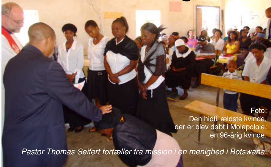
Foto: Den hidtil ældste kvinde, der er blev døbt i Molepolole: en 96-årig kvinde.

Pastor Thomas Seifert fortæller fra mission i en menighed i Botswana.