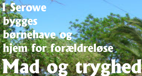
Foto: Vi har allerede et hus og en grund. Nu skal alt det øvrige opbygges.

Mange børn i Botswana bliver forældreløse, fordi AIDS-raten ligger så højt som på 40 %. De mindste børn kan familierne som regel tage sig nogenlunde af. Derimod har de ældre børn det vanskeligere. Dem går det ofte hårdest ud over, og deres vilkår er som tit dårlige. De behøver mad og tryghed.