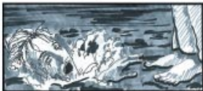
2. Den giver syndernes forladelse Mt. 14, 22-33

Peter sagde til ham: "Herre, er det dig, så befal mig at komme ud til dig på vandet." Han sagde: "Kom!" - Men da han så den stærke storm, blev han bange, og han begyndte at synke og råbte: "Herre, frels mig!"