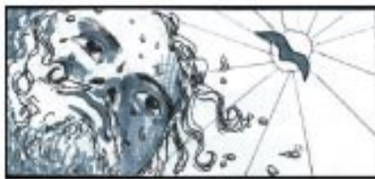
1. Dåben er ikke kun vand Jh. 1, 29-34

- begynder lejsangen og Mikas bog. Her er bud fra alles Skaber til alle. Nu Gud fra himlens telte kommer. Den Hellige træder sin skabning i møde. Magtfuldt er hans ord, selv bjergene må smelte. Han har skabt alt. Mit liv er et vidnesbyrd om hans ords magt. Det kalder mig til at lytte. Men tror jeg Gud, så jeg adlyder, ærer og elsker ham? Eller er det helt andre ting, jeg stoler på og venter alt godt af?