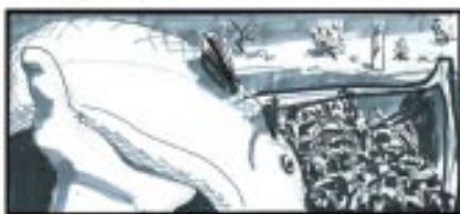
3. Guds ord er sammen med vandet Lk. 5, 1-11

Herren siger: "Læg ud på dybet og kast jeres garn ud til en fangst." Bekend din tro på Gud, som kaster synderne i havets dyb! Og Herren bruger dig til at fange mennesker ind i sin menighed. Men vi har prøvet i bedre tider og intet fanget! Dog "på dit ord vil jeg kaste garnene ud!" Da sker underet! Simon og vennerne bliver brugt og velsignet og oplever "et livets vand, fuldt af nåde."