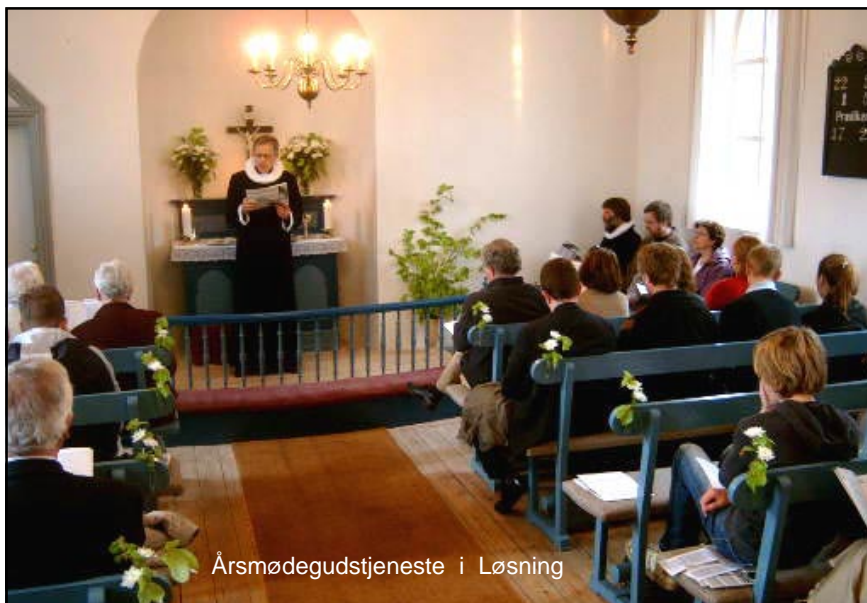
Årsmødegudstjeneste i Løsning

Da får vi desto mere brug for at lytte til bibelens hovedsag: Kristus døde for vores synder efter Skrifterne. Også dette skal prædikkes med myndighed. Vore præster skal gøre det! Nogle vil misbruge nåden til synd og ligegyldighed. Forkynd alligevel. Gør det betingelsesløst og på Kristi vegne. Og bevidn det!