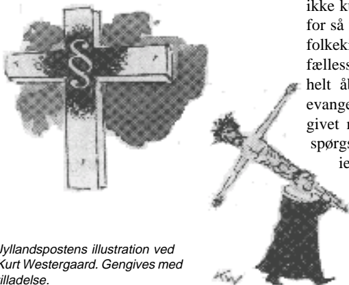
Jyllandspostens illustration ved Kurt Westergaard. Gengives med tilladelse.

Jeg vil ikke besvare nogen med et skønsmaleri af Den Evangelisk-Lutherske Frikirke. Det er ikke en