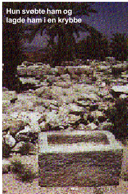
Hun svøbte ham og lagde ham i en krybbe

Byernes navne er historiske og kan stadig besøges. Betlehem har endnu i dag sit centrum i Fødselskirken, som er bygget over en grotte, der meget vel kan være den "stald", hvor Jesus lå i en krybbe. Den første kirke er bygget her i begyndelsen af 300-tallet. Og fra det 2. årh. fortæller kirkefaderen Origines : "I Betlehem blev jeg forevist grotten, hvor Jesus blev født... Hedningerne, som bor dér, viser gerne til den simple grotte, hvor den Jesus blev født, som de kristne tilbeder."