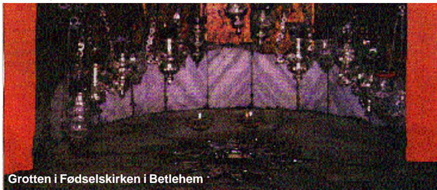
Grøtten i Fødselskirken i Betlehem