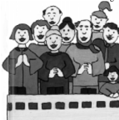
Artiklens illustrationer er fra billebog om gudstjenesten udgivet af SELK, Tyskland

Og det er det faktisk også. Det er så betydningsfuld for Gud, at der står en hel del om det i Bibelen. Mange af